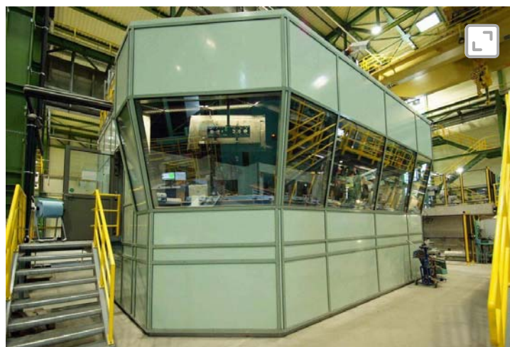
Außenansicht eines Leitstandes

Die Zusammenarbeit zwischen Thyssenkrupp Steel AG und Schunk Mobilraum ist Teil der „Stahlstrategie 20–30“ des Stahlherstellers, die darauf abzielt, das Unternehmen für die Zukunft wettbewerbsfähig zu machen. Schunk Mobilraum wurde aufgrund seiner Expertise und Erfahrung als Partner für die Lieferung der Leitstände ausgewählt.